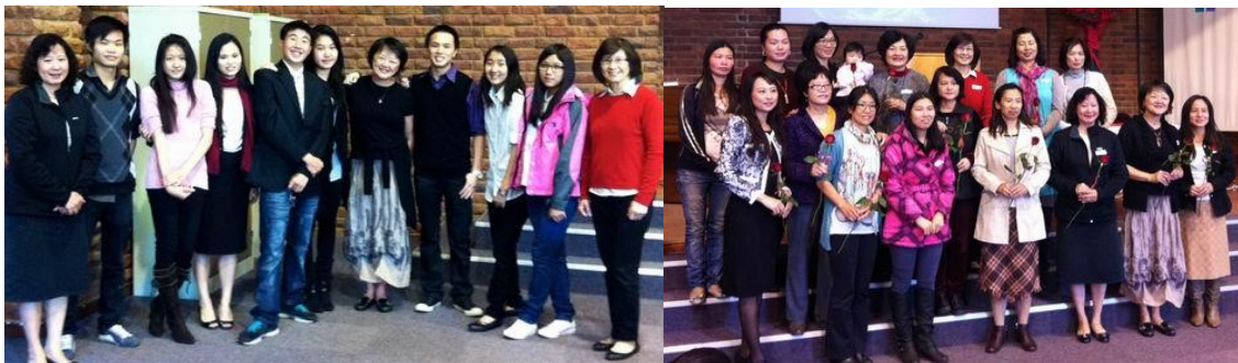
斐京教會學青團契合影