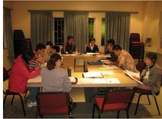
週五晚上的聯合查經班

感謝神在這個月賜給了我們一個特別大的恩典，經過半年的禱告(其實應該說是從 2007 年福清團契成立時就開始禱告，但這次是因為求神預備一個適合的場地)，神終於應允我們：將斐京華人教會(PECCC)的弟姐妹，和比陀福清團契(Pretoria Evangelical Chinese Fuqing Fellowship)的弟姐妹們，邀請在星期五晚上一起查經、裝備造就，雖然總共只有 12 位成員，但是我們夫婦為他們能夠和睦一起尋求屬靈的成長來感恩，而且他們都願意接受挑戰，來輪流帶領查經，特別是福清團契的兩位弟兄，他們說只讀完初中畢業，但是卻豪情壯志的一口答應下來，我們已經在一起聚會四次了，聽到他們彼此分享回應說，都在這查經班大大得着神的恩典供應，我們夫婦就得很得激勵！原來最好的長進方法，就是讓他們自己預備帶查經！樂得我們就專專的為他們禱告神.....，願神興起他們。