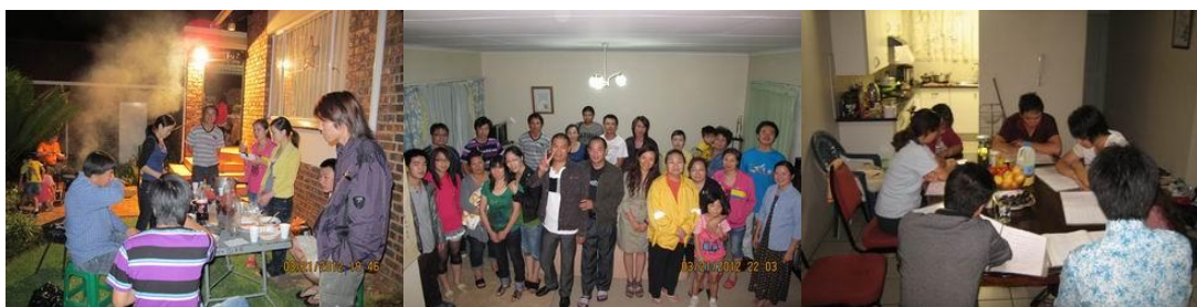
比陀福清團契週三查經班燒烤與聚會

感謝神在這個月賜給了我們一個特別大的恩典，經過半年的禱告(其實應該說是從 2007 年福清團契成立時就開始禱告，但這次是因為求神預備一個適合的場地)，神終於應允我們：將斐京華人教會(PECCC)的弟姐妹，和比陀福清團契(Pretoria Evangelical Chinese Fuqing Fellowship)的弟姐妹們，邀請在星期五晚上一起查經、裝備造就，雖然總共只有 12 位成員，但是我們夫婦為他們能夠和睦一起尋求屬靈的成長來感恩，而且他們都願意接受挑戰，來輪流帶領查經，特別是福清團契的兩位弟兄，他們說只讀完初中畢業，但是卻豪情壯志的一口答應下來，我們已經在一起聚會四次了，聽到他們彼此分享回應說，都在這查經班大大得着神的恩典供應，我們夫婦就得很得激勵！原來最好的長進方法，就是讓他們自己預備帶查經！樂得我們就專專的為他們禱告神.....，願神興起他們。