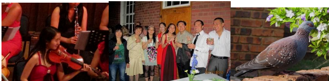
才羽學校樂團表演

我們一家從今年初禱告，若美國免簽成行，就求神帶三個孩子在聖誕假期，前去加州拜會 CIM 總幹事畢師母家；近一年的禱告，拜上帝的恩典，讓台灣政府向美國爭取到免簽證入境的優惠待遇；神垂聽我們的呼求，讓大姑姑、大舅，各為一個孩子負擔機票，而我們夫婦更蒙差會總幹事安排，讓全家一起赴加州差會總部拜會幾位董事，願神保守我們這次行程一切順利。約書亞記 24:15「若是你們以事奉耶和華為不好，今日就可以選擇所要事奉的，是你們列祖在大河那邊所事奉的神呢？是你們所住這地的亞摩利人的神呢？至於我、和我家，我們必定事奉耶和華。」