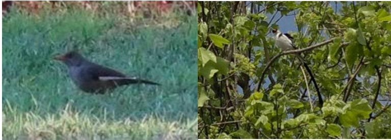
上帝創造真是奇妙