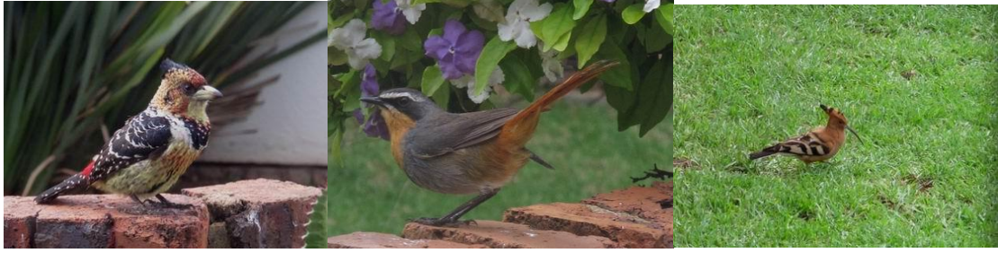
這兩隻這次更近更清楚