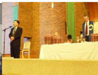
參加白人歸正教會聚會

19/Nov的早上，元國接到借我們場地使用的白人教會牧師來電，邀請我們參加他們每月最後一週的聖餐崇拜，我因為英文不好很想拒絕，但是牧師卻說只要我們一家參加崇拜就好，不必說什麼！他繼續說：我們是阿非利康語聚會，只要你們一家出席，就是最好的見證了；但臨時還是讓我為主的餅杯祝謝。 以賽亞書54: 2「要擴張你帳幕之地，張大你居所的幔子，不要限止，要放長你的繩子，堅固你的橛子。」求主繼續打發祂自己的工人出來，收割祂的莊稼。