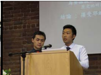
高科弟兄操練講道