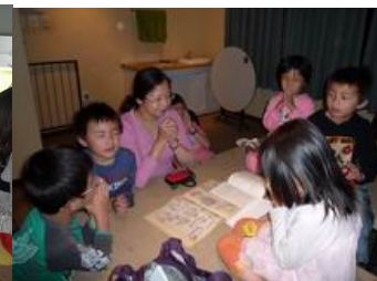
北陀福清教會兒童主日學

創世記1: 28「神就賜福給他們，又對他們說：要生養眾多，遍滿地面，治理這地，也要管理海裏的魚、空中的鳥，和地上各樣行動的活物。」