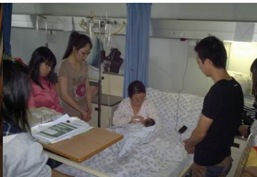
耶穌把女孩變成男孩