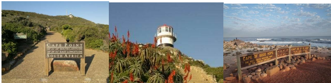
好望角 Good Hope

我們一家也在孩子們考完試後，前去野生動物園，再次觀看經歷神造物的奇妙，每一次元國在園內都會請問別人，有沒有看到 Big Five (獅子、豹子、大象、