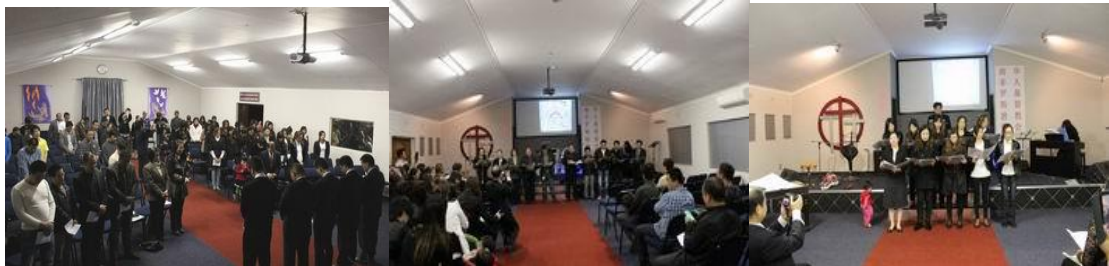
南非羅斯敦堡華人基督教會成立

在同工討論為教會命名的事上，我們夫婦為他們感恩並深受感動，因他們說「羅斯敦堡福清華人基督教會」，有那種限制了其他華人來敬拜神的範圍，所以同心合意的看見要將「福清」去掉，擴大為「羅斯敦堡華人基督教會」RECCC，盼望聖靈領引此地所有的華人都能認識神，不單是福清華人！感謝讚美主。