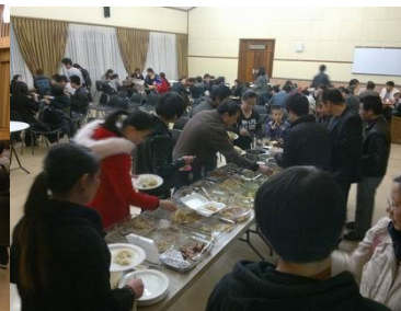
比陀福清華人基督教會1周年感恩禮拜

吳才主參加學校3週的原始生活體驗營(BushCamp)，每天吃1美元價量的食物，沒有電話、沒有網路、電腦，沒有車子，有一天(30個小時)要自己生活(40公