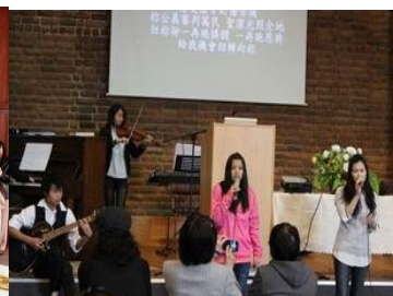
斐京教會學青獻詩