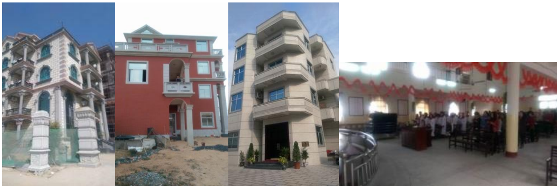
福清人在家鄉花 100~2000 萬人民幣蓋房子

13 年沒有在台灣過農曆新年了，這次因差會刻意的安排，差派 GiKang Kung 牧師前來南非支援事奉兩個月，使我們夫婦得與台灣的親人共度新年，特別是丈母娘非常的喜樂開心，就一同讚美主，歡渡一個美好新年。這次也因檢查的醫院靠近石牌信友堂地區，元國蒙受弟兄姐妹的接待、團契、與禱告，總覺得有著比回娘家更深的感受，讓我們在主裡有美好的分享與代禱，這都要感謝我們的主。