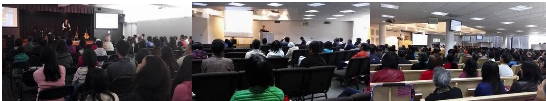
LHCC 活望教會證道分享 CCIC 基督會堂本堂兩堂證道