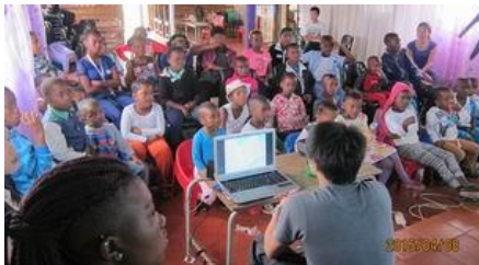
Mother of Peace 孤兒院