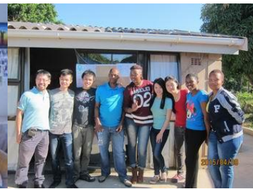
德本黑人教會同工