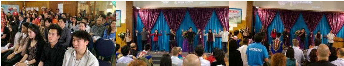
學青團契參加約堡教會 20 周年慶獻詩

週二查經班 現在南非辦證件都要大排長龍 找到退修會適合的場地 詩篇 145：18~19「凡求告耶和華的，就是誠心求告祂的，耶和華便與他們相近。敬畏祂的，祂必成就他們的心願，也必聽他們的呼求，拯救他們。」