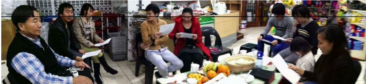
右三庄弟兄兒子 三個月了，探訪西邊 130Km 米德堡城市 Middelburg 弟兄姐妹們

卡」就算被出境官員帶到小房間，但航空公司會去帶人，絕對可以上飛機，因為是自己買票持中國護照回中國；但是萬萬沒有想到，移民居官員搜身拿走每人身上的兩、三百蘭特後，趁他們不注意而拿走他們的登機卡，所以他們被帶著要趕上飛機時，才發現沒有登機卡而不能登機！所幸後來找到這位官員，但他說對不起忘記了！讓三人在機場餓了 24 小時（身上沒錢），第二天所幸有空位順利返國。