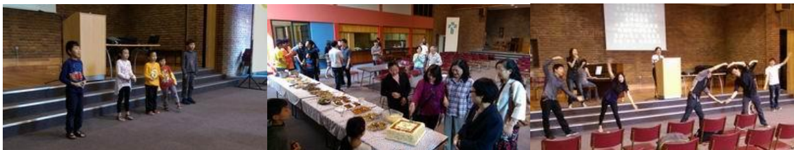
PECCC 斐京華人基督教會 18 週年

這個月底大女兒雙修 Honor，論文終於發表完成，總算順利畢業了，教授還向她要了論文去，她非常的開心，預備開始申請碩士。二女兒申請 Pretoria 比陀大學 (TUK)的醫學系物理治療科 Physiotherapy，在 28 號被通知錄取了，她原本一心想申請去讀慕迪神學院音樂系，現在她請我們幫她好好禱告。