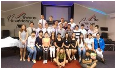
羅斯敦堡華人教會全體合影