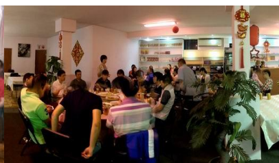
Rustenburg 羅斯敦堡特會講座(在餐廳舉行)