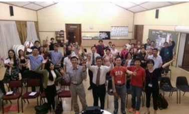
短宣隊比陀福清教會全體合影