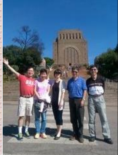
短宣隊認識南非並祝福祈禱