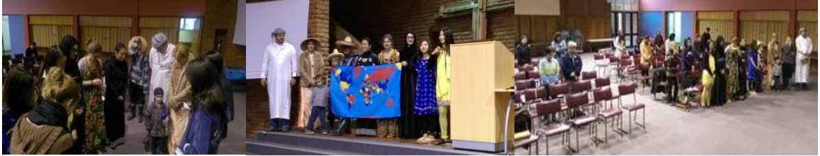
OM 世界福音動員會來訪 分享世界宣教工作 主在各地、各方興起祂的工人

車重量被改成了貨車的重量，官員更是另一隻大龍，也唯有靠主才能得勝完成過戶。路加福音 10：18-20「耶穌對他們說：我曾看見撒但從天上墜落，像閃電一樣。我已經給你們權柄可以踐踏蛇和蠍子，又勝過仇敵一切的能力，斷沒有什麼能害你們。然而，不要因鬼服了你們就歡喜，要因你們的名記錄在天上歡喜。」