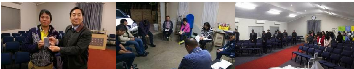
福音 MP4 分送給 lin 弟兄

列王記下 2：14~15「他用以利亞身上掉下來的外衣打水，說：耶和華以利亞的神在哪裡呢？打水之後，水也左右分開，以利沙就過來了。住耶利哥的先知門徒從對面看見他，就說：感動以利亞的靈感動以利沙了。」