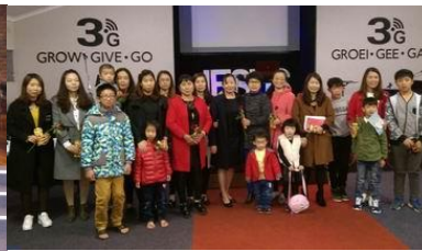
羅斯敦堡教會母親節