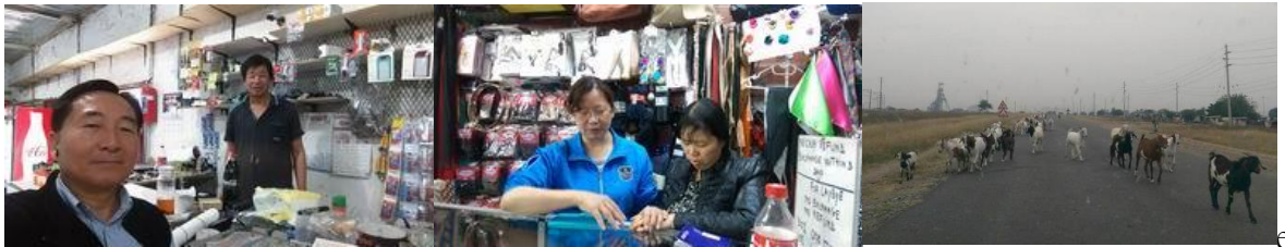
Yen 弟兄在礦區內頂下新店