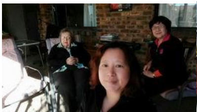
Susan 姐妹探訪伊莉莎伯