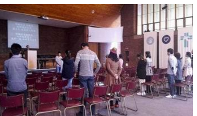
斐京華人基督教會 20 人