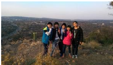
福清兒主放假郊遊爬山

7月21日元國寫 E-Mail 到約翰尼斯堡美國總領館簽證處詢問，兩天後收到回覆：We have reviewed our records and your nonimmigrant visa application is still undergoing administrative processing. Administrative processing often lasts about 90 days, but in some instances, it can take significantly longer. 告訴我繼續等候，或許會要到 90 個工作天或是更久！……在與差會總幹事聯繫參加國際華宣(CIM)25 周年感恩禮拜，並一同述職的事上，讓我們憑信心的連絡支持教會，向神求在 10/Sep 抵美開始整個行程！而當我再次認真讀：美國總領館簽證處的回覆信時，心中真的感受到安慰與盼望：We realize that these extended time periods can cause frustration...we must adjudicate visas in accordance with the provisions of the law, and,…… While we cannot predict when the processing of you visa will be completed, please be assured that we will contact you and do all we can to see that the visa is adjudicated as soon as processing of application has been completed…他們了解我心中的挫折。詩篇 101：1-2 「（大衛的詩）我要歌唱慈愛和公平；耶和華啊，我要向你歌頌！我要用智慧行完全的道。你幾時到我這裡來呢？我要存完全的心行在我家中。」歷代志下 16：9「耶和華的眼目遍察全地，要顯大能幫助向祂心存誠實的人。」感謝神醫治我未信主之前的愚昧，並靠祂恩典，誠實站立在祂面前，蒙恩得平安繼續事奉祂，詩篇 101：6「我眼要看國中的誠實人，叫他們與我同住；行為完全的，他要伺候我。」