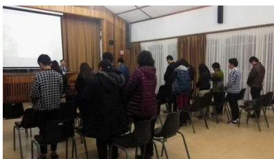
比陀福清華人教會 15 人