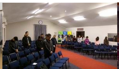
羅斯敦堡華人教會 25 人