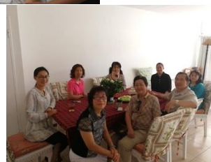
呂姊妹平安返家休養