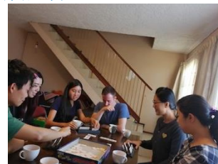
學青團契一同為聖誕福音出擊預備

願主特別祝福聖誕期間教會的每個聚會與活動。藉此向人宣揚聖誕的主角是主耶穌基督，聖誕的意義是主耶穌基督帶來了救恩的福音。賽12：2-4「 神是我的拯救；我要倚靠祂，並不懼怕。因為主耶穌華是我的力量，是我的詩歌，祂也成了我的拯救。所以，你們必從救恩的泉源歡然取水。在那日，你們要說；當稱謝耶和華，求告祂的名；將祂所行的傳揚在萬民中，提說祂的名已被尊崇。 」提早祝弟兄姊妹有一個喜樂蒙恩的聖誕節，願榮耀歸給神。