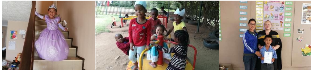
耀恩和溢馨每天的生活都充滿喜樂