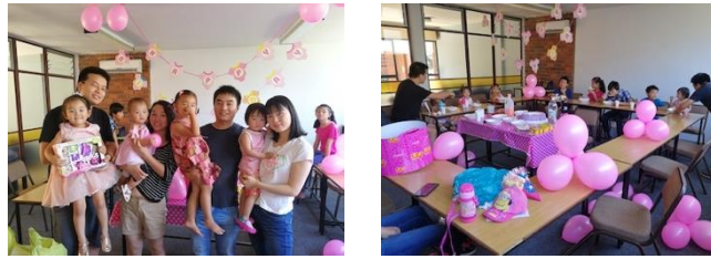
兒主慶生會，家長們用心的佈置