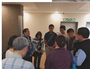
主垂聽眾人的禱告 醫治呂姊妹母子