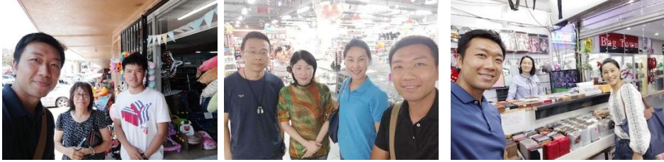
感謝主，領我們接觸到新的福音朋友