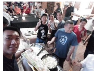
宣教義賣會在風雨中順利進行