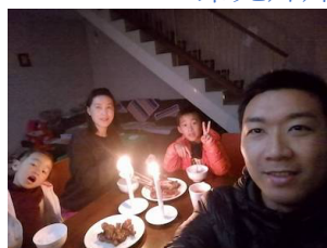
南非特色：馬路上的街舞表演 和 停電的晚上