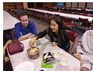
感謝主帶領學青一同學習三福，一同喜樂慶生