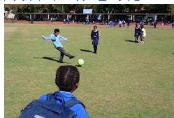
看似神讓兒子和女兒，往文學與運動不同方面發展