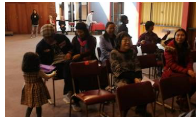
父親節孩子們給天父獻詩，也給地上的父親們送上祝福