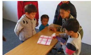
兒主從遊戲體驗 基甸 羊毛的神蹟

剛剛過去的父親節，感謝主，帶領兒童主日學的小朋友一同來獻詩，小朋友在預備時都十分期待，雖然最後有幾位小孩因事不能參加，但一切都很感恩。願主保守兒主的孩子們單純的心，從小就深嘗主恩和主愛。我們一直盼望著兒童主日學可以成為福音的管道，一邊在等候神的時候，一邊跟弟兄姊妹分享異象，並開始邀請福音朋友。感謝主，上週教會的一位弟兄，跟我分享說也希望看到教會有更多年青的家庭，並願意在這方面協助和邀請朋友，願主的靈加倍的感動這位弟兄，並更多其他的弟兄姊妹。也求神賜給我們智慧，使我們前面的各樣安排，都可以配合神的工作。