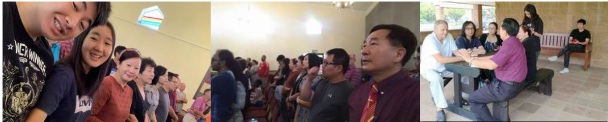
參加Christ Church Sandton教會的主日崇拜

耶利米書33：3「你求告我，我就應允你，並將你所不知道、又大又難的事指示你。」耶利米書33：6「看哪，我要使這城得以痊癒安舒，使城中的人得醫治，又將豐盛的平安和誠實顯明與他們。」感謝神先！我們於上個月商借約堡的兩間教會，都在二月底開會通過把教會借給我們使用；在幾次交通路途往返之後，我們向神求選擇在WOODMEAD較小的Christ Church Sandton這間教會，在參加他們幾次主日崇拜、與週間兩次查經班後，發覺到這間教會的位置地點，是神為我們所選擇的，距離東區Bedfordview 20Km，Edenvale 15km、離Sandton約10Km、西區Randburg、Cresta等25Km，甚至離比陀Pretoria的聖丘瑞恩Centurion約30Km，地點非常適「中」、更奇妙的是，這教會四圍約一平方公里，是全部圍起來的保安社區，安全性也稍為高一些；特別感恩的是，這間教會是英語教會(過去比陀與羅堡借用的三間教會都是說阿斐利康語)，期盼將來能夠與他們有較多的聯結；還有驚訝的是，他們才約有60人聚會，卻大力支持三位宣教士，教會積極參與宣教事工。重要同工Young弟兄對我說：「我們這區域裡是有很多華人，而我們不會說中文，不知道如何向他們傳福音，但神卻派你來了，很奇妙吧。」元國雖然不是頭一次聽到這樣的話，但立刻想起使徒保羅說的歌林多前書 9：16~17「我傳福音原沒有可誇的，因為我是不得已的。若不傳福音，我便有禍了。我若甘心做這事，就有賞賜；若不甘心，責任卻已經託付我了。」