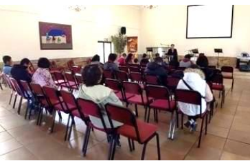
約堡杉騰教會第二次聚會