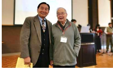
穿這西裝與黃長老合影