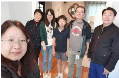
Bao弟兄Huiming夫婦接待住宿 回程南非時西班牙馬德里轉機八小時半日遊

說到先知以利沙，就又想起他的僕人 基哈西 ！求主憐憫我，不要成為一個取財銀子的僕人！不單羞辱主名，自己染上大痲瘋！更禍延後裔！也不會像掃羅王那樣喜愛上好的牛羊、在乎人群的擁抱！甚至找藉口推託、搪塞主的吩咐，還為了保權位去交鬼！更求主保守我不可以像那貪愛世界的底馬，離棄保羅而去…；嗚呼！還有位賣主的猶大啊，更是要切切警惕自己，求主保守我的心思意念啊…。只是不明白之處？？撒母耳怎會膏掃羅？以利沙是怎麼帶出這樣的僕人？連偉大的使徒保羅，又怎麼看中底馬的？耶穌選召12位門徒時，又是如何看走眼猶大的？！主啊！求你憐憫我、保守我！