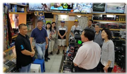
探訪關懷當地弟兄姊妹

這次營會參加的弟兄姊妹有來自斐京教會、羅斯敦堡福清教會，以及約堡行道會的弟兄姊妹。在這三天的營會當中大家都有很多領受，在分組討論的環節中也是踴躍分享彼此生命的見證與改變、相互鼓勵。真看到神在祂的兒女們身上的作為是何等的奇妙，基督的愛是何等長闊高深。哈利路亞！