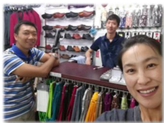
在東方商城探訪華人朋友

感謝主，在華人商城和學青團契中接觸到幾位新的福音朋友，他們沒有宗教信仰，但也願意聽我們的分享，並談論有關信仰的問題，結束時也願意接受我們為他禱告。求主繼續引領，使用弟兄姊妹的見證，聖靈在他們心裡作工。「只等真理的聖靈來了，他要引導你們明白一切的真理」 - 約翰福音16:13