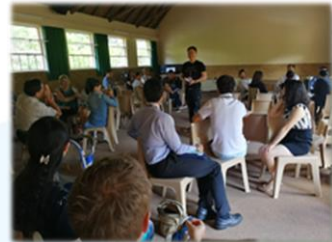
弟兄姊妹一同有美好的敬拜、信息與分享