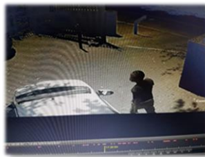
CCTV 拍下在教會偷車的黑人 陪同到警局報案