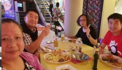
Liu弟兄從台灣返回約堡