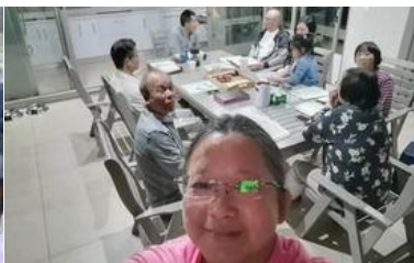
約堡週三晚上查經