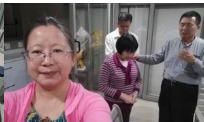
Lin姐妹胃部疼痛禱告

約翰尼斯堡的聚會也是從二月初開始停止崇拜，因為約堡的商人最多，從中國返回南非的人數也多，氣氛也很緊張、詭異！特別在杉騰市Sandton，是華人密集的区域，