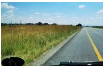
路邊的芒草高過 1.5公尺

使徒保羅說他自己：「難道沒有權柄靠福音吃喝嗎？難道沒有權柄娶信主的姊妹為妻嗎？還是他和巴拿巴沒有權柄不做工嗎？」保羅他繼續說：「然而，我們沒有用過這權柄，倒凡事忍受，免得基督的福音被阻隔。」……我們自以為羅斯敦堡受COVID-19疫情的影響較小，但禱告後聖靈不讓我們聚集聚會！而另一邊約堡我反覺得疫情影響層面較大！神卻很奇妙的讓我們繼續去週二、週三晚上查經！而我們夫婦只覺得好像沒有保羅所謂與所有的權柄！唯聽見有人批評說：我們「不可停止聚會」！也聽見另有人說「不可試探神」！但我們只有緊緊倚靠神、抓緊神！求神幫助我們活出「忠心與良善」。 箴言8：32~35「眾子啊，現在要聽從我，因為謹守我道的，便為有福。要聽教訓就得智慧，不可棄絕。聽從我、日日在我門口仰望、在我門框旁邊等候的，那人便為有福。因為尋得我的，就尋得生命，也必蒙耶和華的恩惠。」