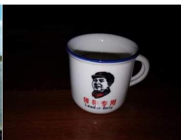
羅堡週一查經班用的茶杯