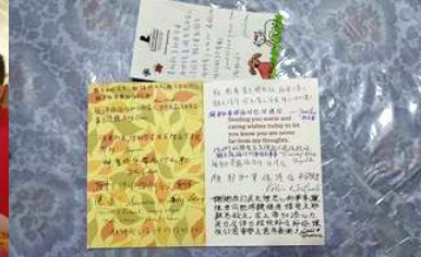
收到聖誕節的卡片感恩