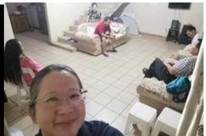
他們迫不及待要恢復聚會

我們2月27號前往羅斯敦堡探訪，感謝神保守弟兄姐妹們都平安！當討論到要在01/Mar恢復聚會之時，又聽見福建福清市再度封城的消息，同時也聽見歐洲多國有疫情感染，非洲也增加到三例，所以大家繼續禱告神，尋求再兩個禮拜時間，盼望能在15/Mar恢復主日聚會。感謝神，唯羅堡週一查經班私下請求我們，能夠從下週開始查經班聚會。