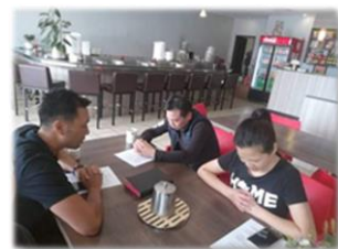
宵禁前受洗造就課程

我們在南非都好，從 3 月初在南非確診第一例後，至今全國有 1600 多宗確診，基於南非的醫療體系上的不足，政府也很快作出相應措施，從 3/27 開始全國宵禁 21 天來控制疫情。南非民眾普遍防疫意識不高，在宵禁期間仍有很多本地人不守規定的出外和聚集，但大家也在慢慢的學習和改變。記得在 3 月初，我們出外帶口罩都會面臨一些異樣的眼光，一位姊妹更被當地人當面指罵說“若你有病就不要出來”。但上週我出去採買時，看到很多當地人也都有帶上口罩和手套。南非政府也很努力的在控制，甚至考慮把宵禁期延長。若延長宵禁，更多的人的經濟壓力將會雪上加霜，這可能會使南非本來就不好的治安變得更差，求主憐憫，也賜當權者智慧，更深認識神的公義和憐憫！