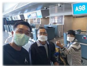
南非黃弟兄夫婦回流台灣