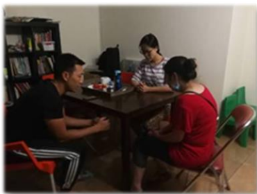
為在化驗室工作的慕道友禱告

在宵禁前的下午，教會一位在醫院化驗所工作的慕道友跟我們分享，南非的醫院管理鬆散，很多資源被濫用或盜用，以至非常時期，在醫院裡前線的醫護人員都缺乏口罩，每個口罩要使用最少兩天。在這樣的工作環境下，她每天上班都非常擔心自己受感染或把病毒帶回家。我們跟他一起禱告，也把家裡有的口罩分一些請他帶去醫院，雖然不多但總比沒有好。我們也把這個需要分享給其他弟兄姊妹。感謝主，就在當天下午，各人都忙著為第二天的 21 天宵禁準備的同時，弟兄姊妹合力收集到 1 千多個口罩捐贈給那家醫院，雖然比起前線的需要都不算多。但感謝主讓弟兄姊妹有一同愛心擺上的機會，有願意的心就經歷神奇妙的工作，也讓大家感受到教會在社會中的責任。約 9：4「趁著白日，我們必須做那差我來者的工。」在疫情期間，很多網上原本收費的資源都改為免費的分享，這是主的恩典，願弟兄姊妹藉著彼此分享，活出基督的愛。