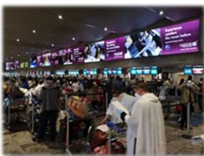
大批華人抓緊機會在宵禁前離開

親愛的弟兄姊妹，你們都好嗎？疫情在全球的影響越來越嚴重，層面也越來越廣，看到受感染和死亡的人數不斷的上升，看到許許多多的國家、人民，在經濟上、生活上受到嚴重的衝擊。每看到這些的消息，都想到在遠方為我們代禱的同工們。也許我們現在所面對的處境不是那麼容易，願慈愛憐憫的主，賜給我們幫助與安慰。也求主看顧我們和家人身體的健康、生活的需要，並在基督耶穌裡保守我們的心懷意念。