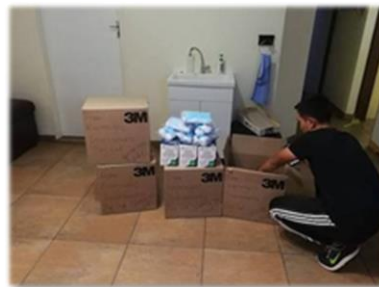
教會弟兄姊妹捐贈口罩