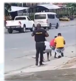
警察讓不遵守宵禁規定的市民採在街道做運動

在疫情的期間，雖然各地都無法聚集，但我們仍然能透過網絡來聯繫，若是在 10 年前，我想那挑戰一定就更大。感謝主，總會為弟兄姐妹們預備，連長輩們也願意一起學習用新的方式來敬拜，團契。主說：「你們拜父，也不在這山上，也不在耶路撒冷。……時候將到，如今就是了，那真正拜父的，要用心靈和誠實拜祂……（約 4：21-24）」