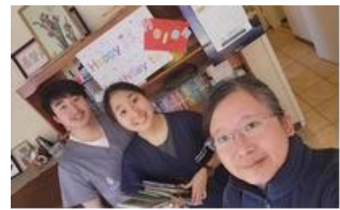
06-01才羽返工作/才主返校

六月初的時候，元國忽然收到李道宏牧師邀請，參加他們「綫上敬拜讚美社」ZOOM聚會，李牧師現在是福音證主協會、愛主第二代事工帶領人；他在會中訪問我們夫婦在宣教職事工場上的夫妻關係、及事奉的難處與挑戰！會後並製成幾段3分鐘視頻發放，元國夫婦非常感恩，若能為主使用，都要歸一切感謝與榮耀給我們的主耶穌！