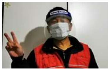
元國外出購物的裝備