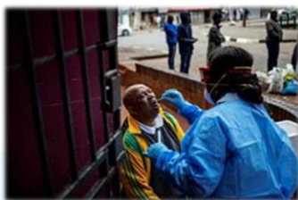
黑人區逐家逐戶的檢驗

南非的感染人數仍在不斷上升，至 7 千多人，封城對疫情的控制有一定的幫助，但同時也對人民的生活和經濟造成很大壓力，有些地方出現小規模的暴亂。政府的從 5 月 1 日開始有小程度的解封以解民困（迫於經濟壓力，由最高級別 Level5 降為 Level4），在各種限制下很多商店、公司都開始復工。復工的民眾心情也是矛盾，開店的弟兄姊妹分享說：“沒客人擔心收入，客人多又擔心被感染，最後只能交給主了。”雖然逐漸復工，但很多的店鋪、公司早已撐不住而結業，帶來多少人失業、多少家庭面臨困難，想到這就會充滿無奈和感慨。求主憐憫一切在困境中、渴望祂眷顧的人。賽 25：4 「祢就作貧窮人的保障、作困乏人急難中的保障、作躲暴風之處、作避炎熱的陰涼。」