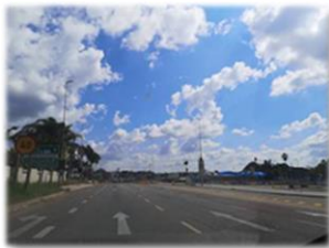
神造的天空簡潔而漂亮

短短幾個月時間，這個世界變得很不一樣。在 1 月份看到中國武漢封城的報導的時候，很難想像這麼大的城市，經歷這麼長的時間的停止工作和活動，接下來要如何面對各樣的挑戰？但接著看到世界多個國家也因疫情而相繼實行各種程度的封城，漸漸覺得這是理所當然發生的事。南非全國封城一個多月，感覺好像已經很久了。感謝主，我們還有社區花園一點戶外空間可以活動，每次仰望天空都讓我想，雖然世界變得如此的擾攘，但神原本所創造的大自然和天空一點都沒有改變，像在述說神的慈愛、信實，祂向世人施予的的恩典憐憫從未改變，祂仍然是以笑臉幫助我們的那位神，不管將來世界變得如何，我們仍然能仰望祂和讚美祂，詩篇 72：5 「太陽還存，月亮還在，人要敬畏祢，直到萬代。」