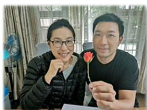
花店不開仍有主的預備

南非封城期間，我們的一位朋友因一個人滯留在另一個非洲小國，回不了南非而感到非常擔憂。馨月透過網絡來關心她，慢慢聽她分享、並為她禱告，過了幾天她決志相信耶穌，還很渴望認識神！她自己在當地想辦法找到了一本中文聖經，每星期很積極的跟我們在線上上初信課。感謝主在這位姊妹身上的工作，雖然國家都可以被封起來，但福音的門卻是無人能關。不論環境如何的改變，但「耶穌基督昨日、今日、一直到永遠，是一樣的。」（來 13：8）