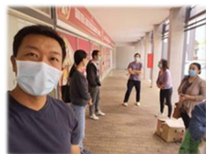
採買成為與弟兄姊妹碰面另一機會

南非封城期間，我們的一位朋友因一個人滯留在另一個非洲小國，回不了南非而感到非常擔憂。馨月透過網絡來關心她，慢慢聽她分享、並為她禱告，過了幾天她決志相信耶穌，還很渴望認識神！她自己在當地想辦法找到了一本中文聖經，每星期很積極的跟我們在線上上初信課。感謝主在這位姊妹身上的工作，雖然國家都可以被封起來，但福音的門卻是無人能關。不論環境如何的改變，但「耶穌基督昨日、今日、一直到永遠，是一樣的。」（來 13：8）