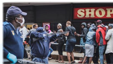
警察控制人群聚集次序