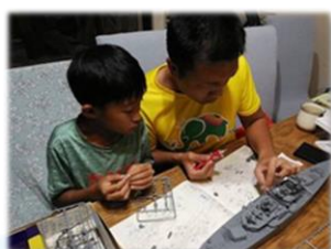
與孩子的親子時間