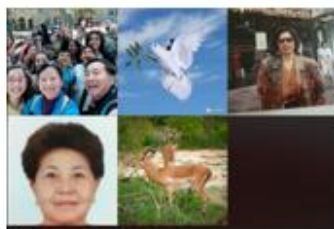
周二上午約堡實用讀經