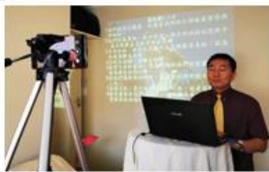
主日播放 YouTube 崇拜講道

經歷聖靈奇妙的帶領與供應！讓幾位弟兄姐妹教授、指導，元國學習使用視頻工具，從三月開始幾次錄音講道後，自 05/April 起，以 YouTube 錄製主日崇拜上傳網路播放 (因考慮羅斯敦堡弟兄姐妹白天開店)，同時立即用 WeChat、Line、WhatsApp、Zoom 等軟體開始線上聚會查經，分享與禱告，使我們能在鎖國狀況中，仍能一同聚集敬拜神，仰望主恩典，不受疫情影響繼續聚會！且蒙神保守眾弟兄姐妹至今平安。