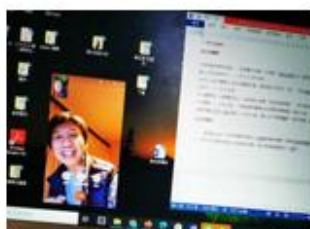
周三晚上一對一查經