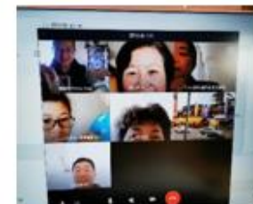
周三上午婦女查經