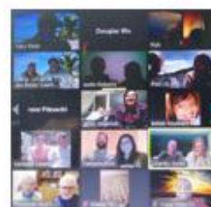
每月 1~2 次白人教會崇拜