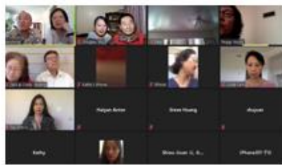
主日傍晚 6~7 點 證主宣教士崇拜