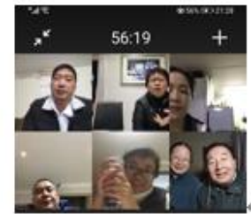
主日晚 8~10 點羅斯敦堡同工