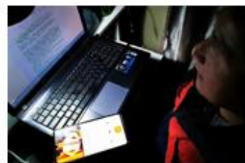
周二晚上約堡實用讀經 1 位