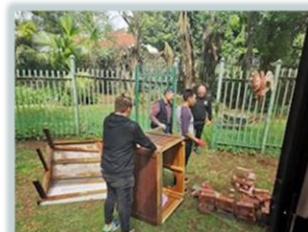
隣居給我們家小房子的， 迎接雨季的來臨

自從南非疫情防控降到 1 級後，每天的新增確診一直保持在 1-2 千人左右，感謝主，減低防控後目前為止沒有帶來重大的反彈。中、小學也全面復課，我們孩子也在今年最後的學期回到學校。當地的教會也開始開放實體聚會。使今年的年底有如年初的感覺，大家都學習在這個新常態 New Normal 裡重新起步。