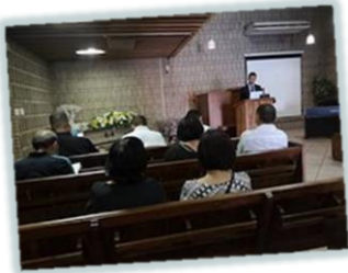
梁弟兄哥哥追思會

一轉眼今年就接近尾聲了，今年真是特別難以預測的一年，很多出人意料的事情，有些不如我們所期待，甚至有些失望，更讓我們體會到雅各書說的「 其實明天如何，你們還不知道 」（雅 4：14）。但感謝主的是，我們可以在這變幻莫測的世代中仍然有確據和信心，因為知道我們的主仍然掌權，祂常用祂權能的命令托住萬有。更相信「 天怎樣高過地，照樣，我的道路高過你們的道路，我的意念高過你們的意念。 」（賽 55：9），願我們常在當中做醒禱告，留心主的帶領，跟隨主的腳步。