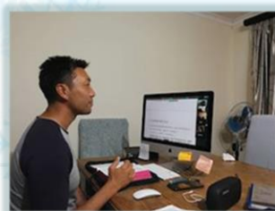
週 1~5 晚上的查經、團契

家庭方面，兒子耀恩剛滿 11 歲了，最近也在他身上看到心裡上的一些轉變，已經不再是從前那個小男孩。前幾周因為和朋友發生的一些事情，讓耀恩的心情十分沮喪，感謝主在當下幫助馨月去傾聽，讓耀恩的情感有抒發的渠道，並且在事後，透過談天的過程，耀恩更多的表達出他心裡一直以來的放不下的一些事情，讓馨月更具體的知道要如何為孩子禱告。高科因服事繁忙，和耀恩的關係比較疏離。希望大家為高科、馨月禱告，使我們更有懂得陪伴耀恩走信仰的道路。