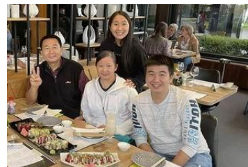
Xu 弟兄父子搬來豪登省 確診數字下降出來走走 孩子領第一份薪水請吃飯

羅斯敦堡白人牧師說他們教會只有 1/4 人數聚會，在 15 人左右；杉騰教會白人牧師說他們分成兩堂，一堂約 20 人左右，約 1/3 人數聚會，都是受到場地限制原故；他們都說非常想念我們。彌迦書 7：11~12「以色列啊，日子必到，你的牆垣必重修；到那日，你的境界必開展（或譯：命令必傳到遠方）。」願主快快將這疫情止息，使我們得恢復正常作息，趁著白日，竭力做主工，得蒙祂喜悅。