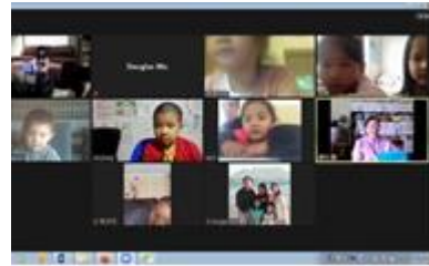
四位新加入兒主的孩子 耶穌聽小孩的禱告 週二上午兒童主日學

撒迦利亞書 10：12「我必使他們倚靠我，得以堅固；一舉一動必奉我的名。這是耶和華說的。」西番雅書 3：9「那時，我必使萬民用清潔的言語好求告我耶和華的名，同心合意地事奉我。」神還賜給慧玲聆聽的恩賜，在鎖國封鎖期間成為最好的事奉利器，更感恩神賜她耐心與愛心傾聽，使我們多人在這困境中，能轉眼仰望耶穌，釘睛在祂奇妙慈容；並透過禱告神，得在面對新冠病毒疫情、以及經濟退縮，及治安更加敗壞中，向撒但誇勝，使我們得着出人意外的平安。