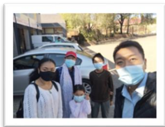
新認識的樂姊妹 母女

來 10: 24「又要彼此相顧、激發愛心、勉勵行善。」看到弟兄們願意彼此陪伴、扶持，同心靠主，為此十分感恩。我們的能力時間都有限，更需要弟兄姐妹們和我們一同配搭彼此同心。願神幫助我們在當地的信徒中，可以培養願意委身服事的門徒。