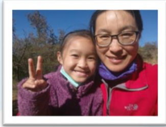
和女儿、儿子单独的小约会