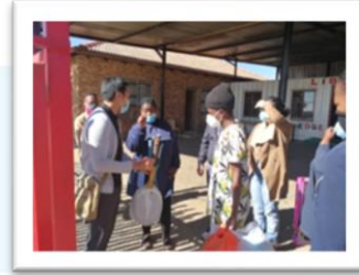
代表教會到孤兒院捐贈冬天物資