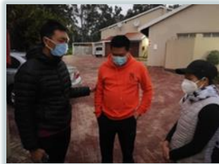
為出國打疫苗的弟兄姊妹禱告

南非政府在一個多月前已開始為醫護人員和 60 歲以上國民施打新冠疫苗，下一批接種疫苗的群体会是 40 歲以上的勞動工人。也有很多華人會去南方鄰近國家施打疫苗。無論如何，希望都有助減低本地疫情的蔓延。而我們之前一直禱告，希望在 6 月份可以開始復主日實體聚會，但按目前情況我們還是繼續禱告等候，求主繼續帶領、顯明合適的時間，同時讓弟兄姊妹在主的愛裡勝過懼怕，在基督裡有平安。