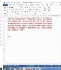
週三日間 網路 查經