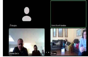
主日杉騰白人教會聚會連結