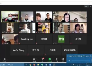
石牌信友堂宣教團契分享