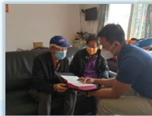
馮先生、馮太太在病痛中信主得救