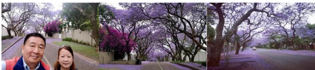
南非 Pretoria 斐京的紫葳花 Jacaranda 今年盛開