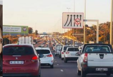
鎖國解封高速公路的車潮