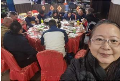
接觸約翰尼斯堡未信主朋友