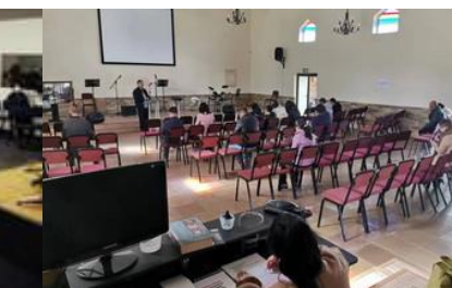
約堡杉騰教會崇拜人數 18 人

詩篇 71：15~18「我的口終日要述說你的公義和你的救恩，因我不計其數。我要來說主耶和華大能的事；我單要提說你的公義。神啊，自我年幼時，你就教訓我；直到如今，我傳揚你奇妙的作為。神啊，我到年老髮白的時候，求你不要離棄我！等我將你的能力指示下代，將你的大能指示後世的人。」詩篇 76：25~26「除你以外，在天上我有誰呢？除你以外，在地上我也沒有所愛慕的。我的肉體和我的心腸衰殘；但神是我心裡的力量，又是我的福分，直到永遠。」