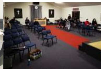
羅斯敦堡教會崇拜人數 20 人