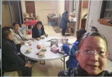
Wang 姐妹在後煮食事奉