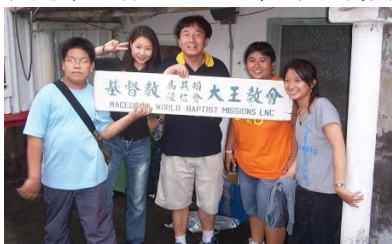
20 年前實習教會台東短宣

詩篇 71：15~18「我的口終日要述說你的公義和你的救恩，因我不計其數。我要來說主耶和華大能的事；我單要提說你的公義。神啊，自我年幼時，你就教訓我；直到如今，我傳揚你奇妙的作為。神啊，我到年老髮白的時候，求你不要離棄我！等我將你的能力指示下代，將你的大能指示後世的人。」詩篇 76：25~26「除你以外，在天上我有誰呢？除你以外，在地上我也沒有所愛慕的。我的肉體和我的心腸衰殘；但神是我心裡的力量，又是我的福分，直到永遠。」