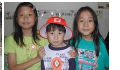
出發南非宣教工場之前