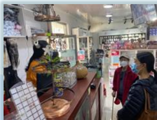
與 樂姊妹 一同探訪

早前從非洲國家 Botswana 退休搬回南非的樂姊妹，她說希望退休後多為主傳福音，更請我們有時可以帶她一起去探訪福音朋友。她常常也會私下關心福音朋友，然後邀請我們一起去關心，感謝主，讓我們身邊有這些熱心愛主的姊妹。也盼望下半年，可以像過去那樣組織教會弟兄姊妹一同去福音探訪。