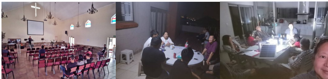
杉騰教會主日崇拜停電