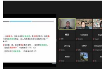
芝加哥活水福音教會 Fu 弟兄 帶領 Weng 決志信主 14/09 週三 Fu 弟兄專講

芝加哥活水福音教會 Fu 弟兄特來南非探望我們，帶來娘家般的欣慰與鼓舞，除了帶來阿斯匹靈、維他命 C 等，適時補足我們的短缺；他更願意分享主話語的恩典，「凡與我們有益的，他沒有一樣避諱不說的，或在眾人面前，或在各人家裡，他都教導我們」；使我們看見神宣教事工的信實應許；他還樂意前往約堡華人商城探訪、抓緊機會向 Weng 弟兄傳福音，使他決志信主！神更賜福我們，在他停留的週三晚限電情況下，有 16 位參加線上聚會。哥林多前書 15：57~58「感謝神，使我們藉著我們的主耶穌基督得勝。所以，我親愛的弟兄們，你們務要堅固，不可搖動，常常竭力多做主工；因為知道，你們的勞苦在主裡面不是徒然的。」