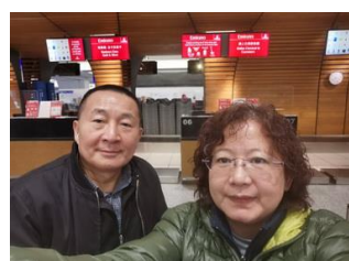
石牌信友堂為元國夫婦禱告 南非羅斯敦堡教會……歸心似箭