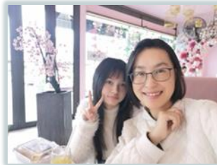
嘉音姐妹準備回國

感謝主，5 月初教會新來了一個家庭（父母親和兩個讀小學的女兒），他們在南非已十多年，但過去在白人教會聚會，最近他們有感動想到華人教會，就來到了斐京教會。參加幾次聚會後他們跟我們表示願意穩定委身在這教會，他們也積極邀請自己未信主的公司老闆來教會，而他的老闆剛好是我們很久以前曾遇過的福音朋友。沒想到 3 年後的今天，神繼續藉著其它弟兄姐妹將這位朋友帶到教會，願主美好的心意成就在每一個福音朋友的身上。