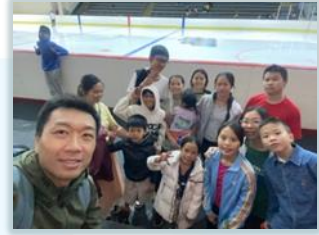
兒童主日學校孩子活動