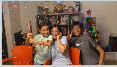
為溢馨補慶祝 10 岁生日