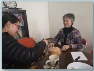
馨月母親慶生感恩