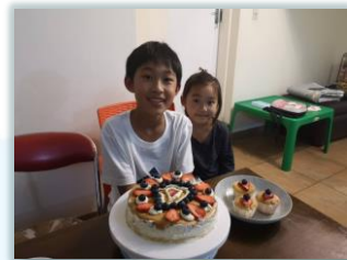
在店裡探訪弟兄姐妹