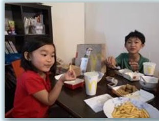
半年來第一次的麥當勞