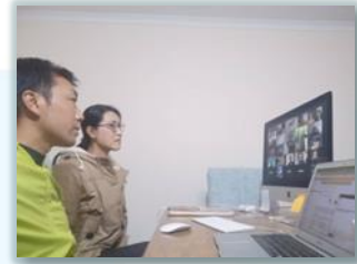
第一次參加 "洛桑宣教大會"